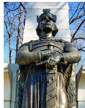
Mieszko I cieszyński