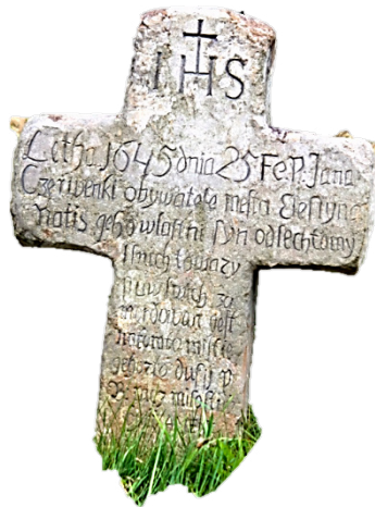
Smírčí kříž z obce Pruchna – jeden z posledních svědků smírčího práva na Těšínsku.