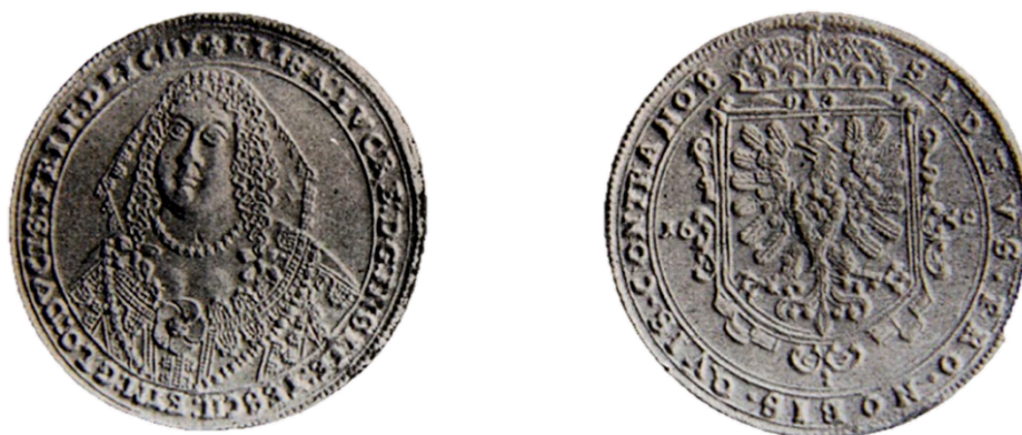
Tolar kněžny Alžběty Lukrécie z roku 1650.

Poslední mužský potomek z rodu Těšínských Piastovců Fridrich Vilém provozoval ražbu mincí v letech 1620–1624 v Těšíně, ale také v mincovně ve Skoczowě. Alžběta Lukrécie mohla ražbu mincí obnovit až v roce 1638. Podle nařízení císařské komory však musela razit drobné mince s portrétem císaře Ferdinanda III. Se svým portrétem mohla razit jen toлары a dukáty. Díky tomu se nám do dnešního dne zachoval jediný autentický portrét kněžny.